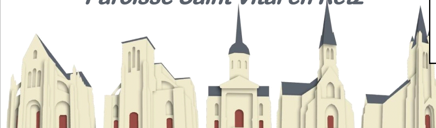
St Père en Retz