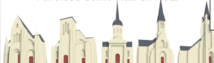
St Père en Retz