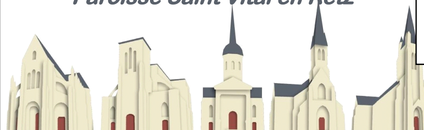
St Père en Retz