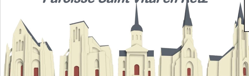
St Père en Retz