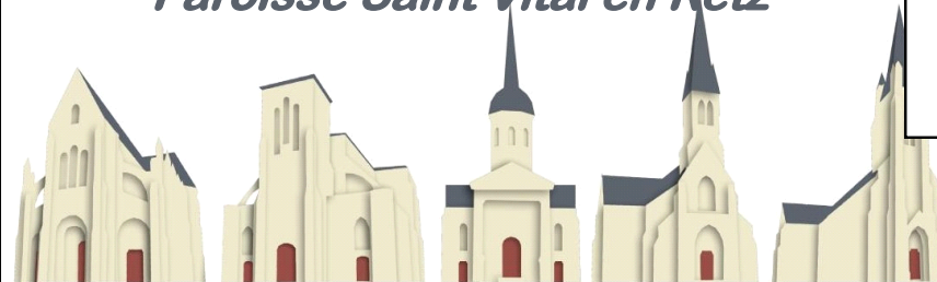
St Père en Retz