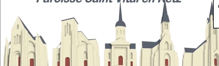
St Père en Retz