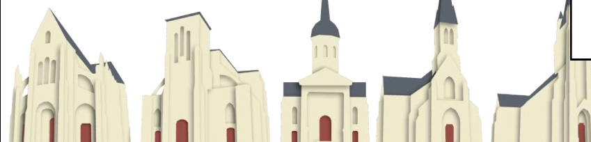
St Père en Retz