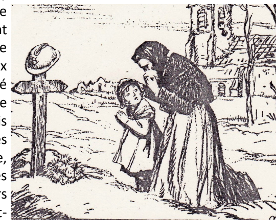
- Papa sait-il qu'on est vainqueur ? Document

« Le lundi 11 novembre à une heure de l'après-midi nos cloches [...] ont sonné à toute volée pendant une demi-heure pour annoncer aux habitants que l'armistice est signé [...]. C'était la fin de l'horrible guerre qui ensanglantait le monde depuis plus de 4 ans [...]. Vous auriez vu les Paimblotins dans la rue, fous de joie, organisant des défilés, des marches triomphales qui duraient deux jours et deux nuits. Au Salut [du Saint-Sacrement] de lundi soir (pendant toute la durée de la guerre, c'est-à-dire pendant 4 ans et demi, il y a eu Salut à la paroisse tous les jours sans interruption) les fidèles viennent très nombreux dans un élan spontané de reconnaissance, et bien des larmes coulent des yeux au cours de cette très simple cérémonie qui revêt un caractère particulièrement émouvant quand les assistants entonnent en chœur le chant du Magnificat. » (Abbé Joseph Robert, extrait du Compte-rendu du Te Deum d'action de grâce du 17 novembre 1918 ).