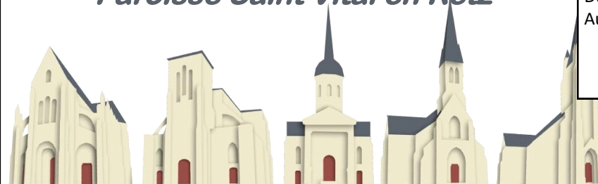
St Père en Retz