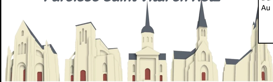
St Père en Retz