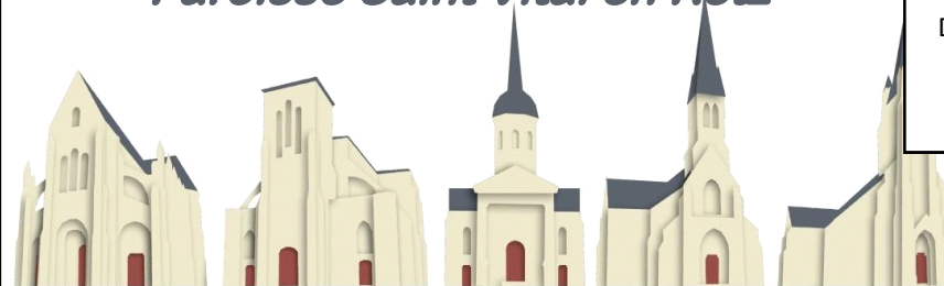
St Père en Retz

11, Rue Abbé Perrin—ST PERE EN RETZ tél. 02.40.21.70.61