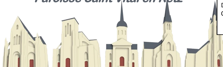
St Père en Retz