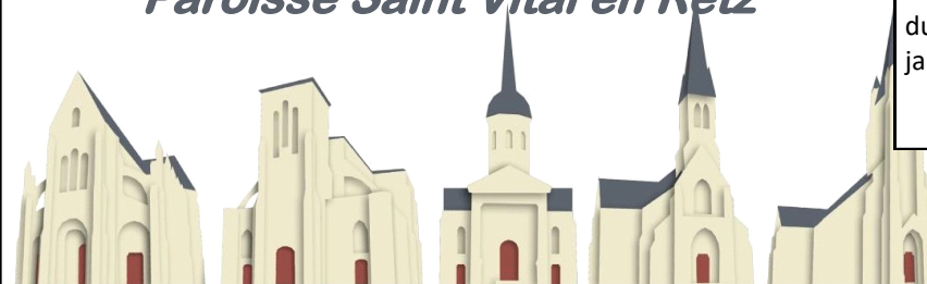
St Père en Retz