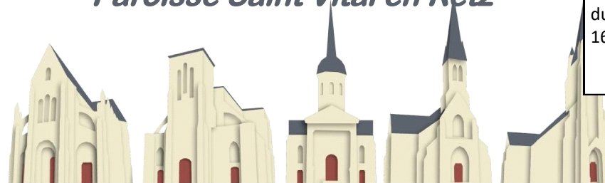
St Père en Retz