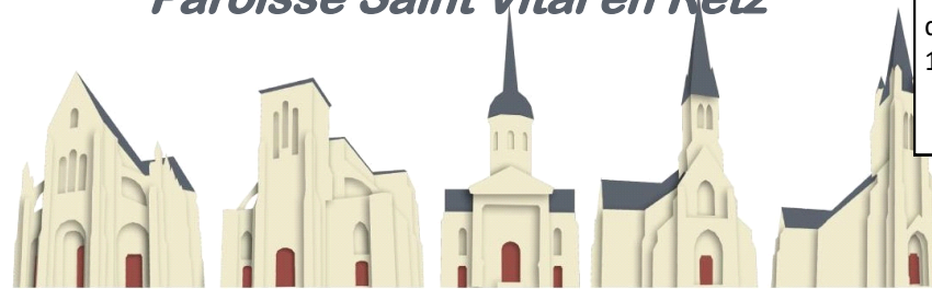
St Père en Retz