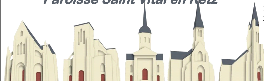
St Père en Retz