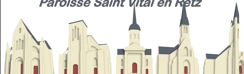
St Père en Retz