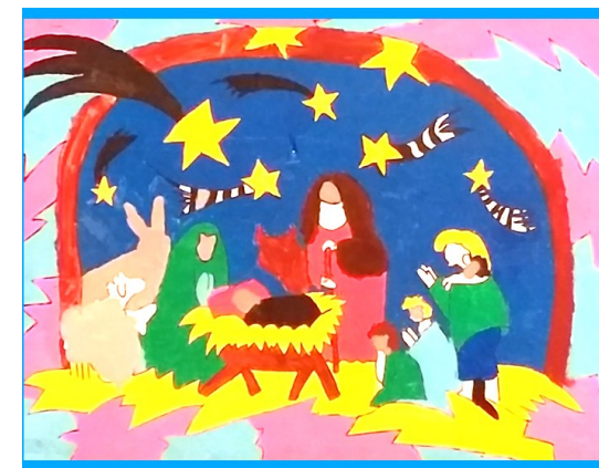
Crèche réalisée par les élèves de CM1 & CM2 de l'école du Sacré Cœur de Paimboeuf