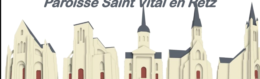
St Père en Retz