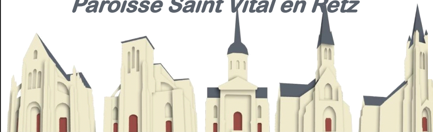
St Père en Retz