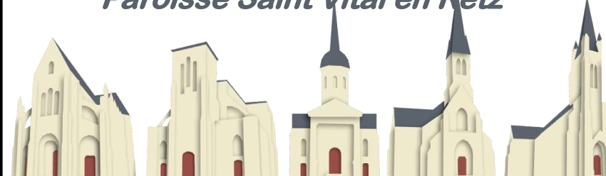
St Père en Retz