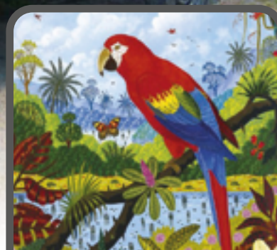
P.6 EXPOSITION : ALAIN THOMAS