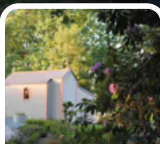
P.3 SUR LES PAS DE SAINT VITAL