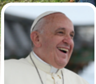
P.2 UN TRÉSOR RETROUVÉ