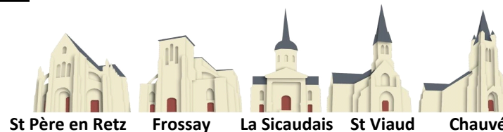
St Père en Retz

11, Rue Abbé Perrin—44320 SAINT-PÈRE-EN-RETZ tél. 02.40.21.70.61